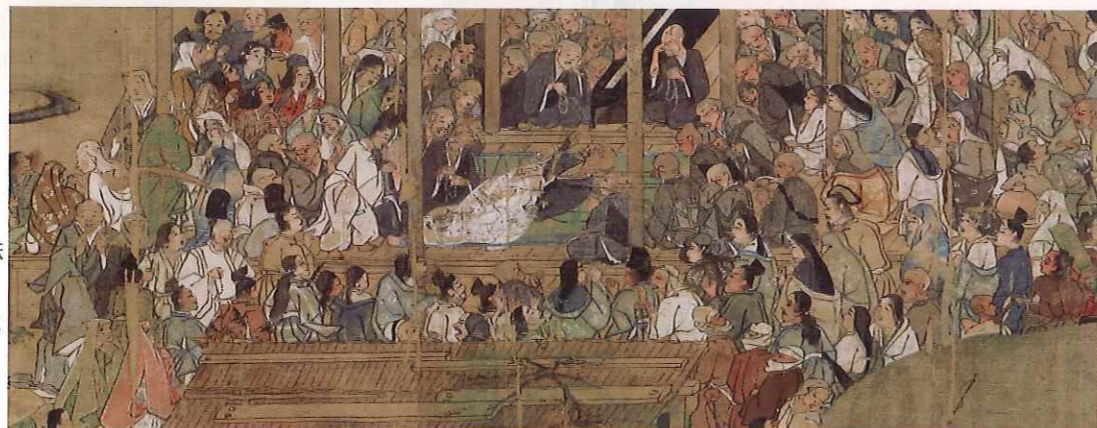
第十二巻 第三段 一遍往生