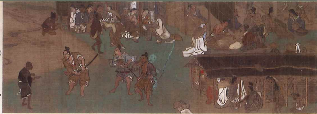
【関連行事】 第四巻 第三段 備前福岡の市