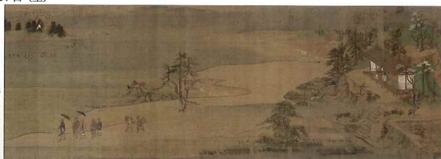
第一巻 第二段 聖戒と共に太宰府へ